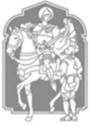
St. Martinus Spekholzerheide