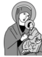
OLV van Altijdurende Bijstand - Heilust